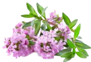
ИНГАВИТ С ПРОПОЛИСОМ СРЕДСТВО ГИГИЕНЫ ПОЛОСТИ РТА