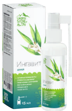
ИНГАВИТ СРЕДСТВО ГИГИЕНЫ ПОЛОСТИ РТА